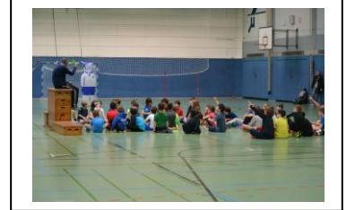
Ansprache vor der Siegerehrung