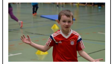
Milan nach dem vom Torwart parierten Wurf