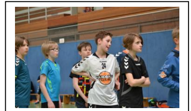
Auch konzentriertes Zuhören gehört beim Handballcamp einfach dazu!